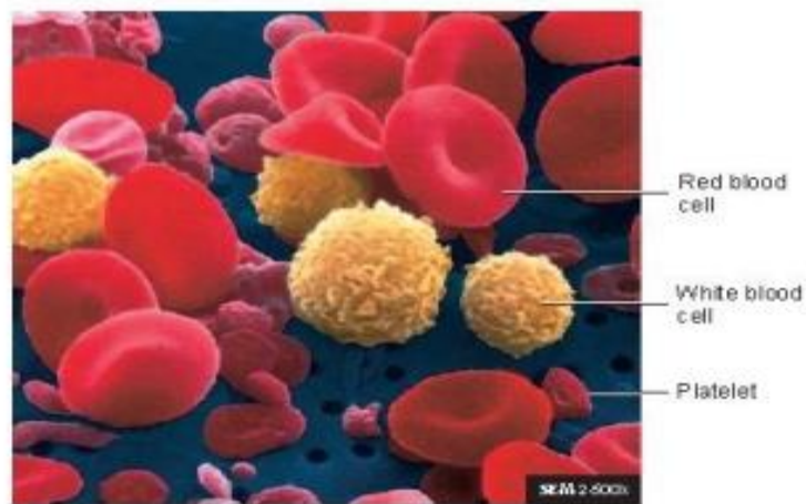
GAMBAR 1. Komponen darah

Darah adalah jenis jaringan ikat, terdiri atas sel-sel (eritrosit, leukosit, dan trombosit) yang terendam pada cairan kompleks plasma (gambar 1). Warnanya merah cerah didalam arteri (sudah dioksigenasi) dan berwarna merah ungu gelap di dalam vena (doeksigenkan), setelah melepas sebagian oksigen ke jaringan (menyebabkan perubahan warna) dan menerima produk sisa jaringan (Saadah 2018).